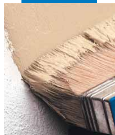
Revestimiento con Elastocolor Pittura