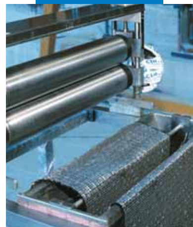
Impregnación a máquina de MapeWrap C