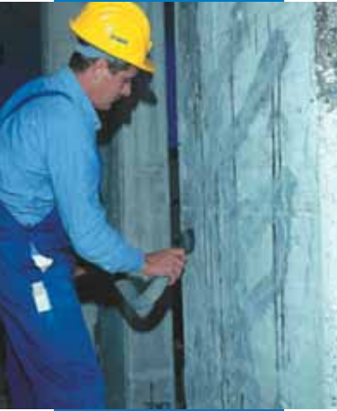
Preparación del soporte