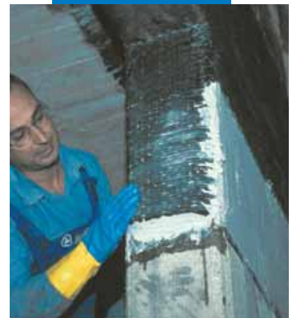
Fajado de pilares y vigas