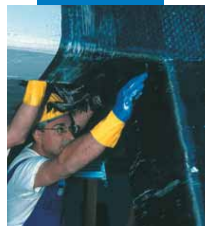
Fajado de un encuentro viga-pilar