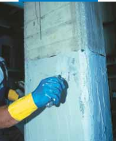
Enlucido con MapeWrap 11 o MapeWrap 12

Respecto a la técnica de chapado con planchas metálicas (béton plaqué), el uso de los tejidos MapeWrap C UNI-AX o MapeWrap C UNI-AX HM permite la adaptación a cualquier forma que tenga el elemento a reparar, no necesita apuntalamientos provisionales durante la puesta en obra y elimina todos los riesgos relacionados con la corrosión del refuerzo aplicado.