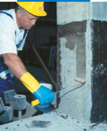
Aplicación de MapeWrap Primer 1