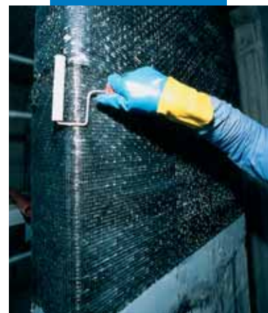
Aplicación de la segunda mano de MapeWrap 31

Es indispensable que los operarios durante la preparación y la colocación de los sistemas epoxídicos descritos utilicen guantes impermeables de goma, gafas de protección y máscaras para disolventes. Evitar el contacto con la piel y con los ojos; en el caso que se produzca el contacto, lavarlos con abundante agua y jabón y consultar a un médico. Cuando la aplicación se realice en ambientes cerrados, airear bien los locales, de forma que se garantice una constante renovación del aire. Durante el trabajo, además, no deben haber llamas libres ni se debe fumar. Para