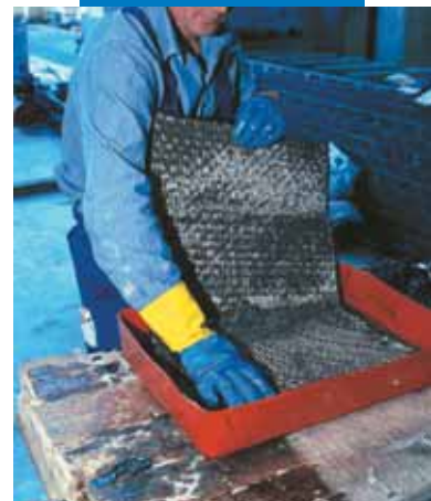
Impregnación manual de MapeWrap C